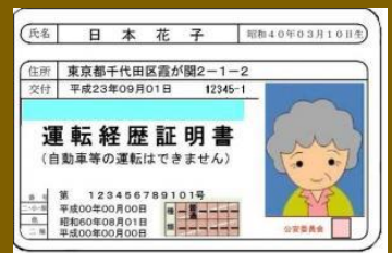
↑銀行でも使えて、更新不要！

健康面からも、お年を召されても元気にどんどん外に出かけて頂きたいが、同時に車の運転に際してのリスク増大も認識は必要。事故防止の観点からも運転免許自主返納制度の理解促進を行政としても進めていくべきであり、並行してタクシーやバスの割引など返納者への支援も検討して頂きたい。