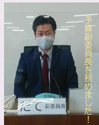
予算副委員長を務めました！

ホームページ : www.datejun16.net メール : info@datejun16.net