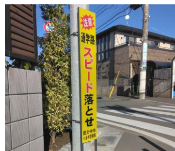
北町1丁目交差点に看板設置