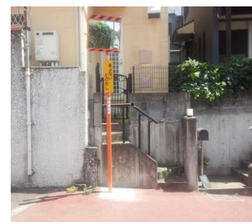
光町にカーブミラー設置