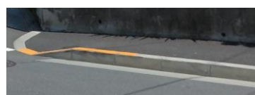
西町の危険な段差の解消