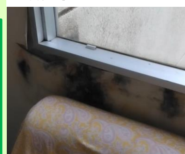
雨漏り等によるカビ・はがれ

また、建物については計画上、長寿命化の予定で、その際に設備や内装も一新する方向のようですが、地域住民の声、ニーズをしっかりと汲み取って、必要があれば高さ活用の余地もある、建て替えも視野に計画の見直しを行うよう要請しました。どちらにしろ10年先ですので設備の入れ替え、修繕はしっかり行ってもらうよう、引き続き働きかけます！