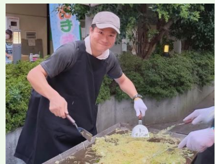
楽しい夏祭りも町会がないとできなくなってしまうかも。

答弁 デジタル化は有効な手段と考える。先進市の導入事例等を研究し、必要とされる支援があれば行っていく。