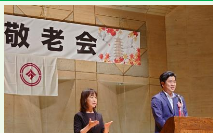
今年の敬老会でもお元気な姿をたくさん見られました。