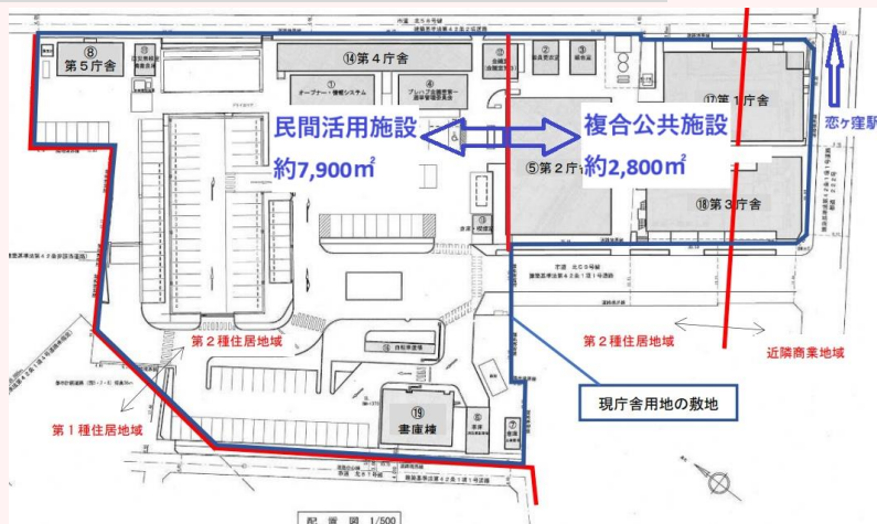
↑ 複合公共施設には恋ヶ窪図書館・公民館・武道館福祉センター、弓道場が入る予定です。