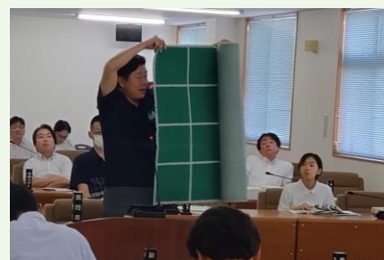
このカーペットのマス目上を規則的に進んでいきます。

答弁 熱中症対策と介護・フレイル予防は両輪で進めるべき。周知啓発に取組んでまいります。